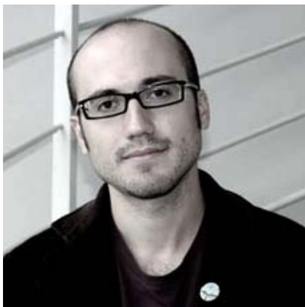
El compositor Octavi Rumbau

Diu Tristan Perich que la seva instal·lació Octave , present al Foyer de la Sala 3 de L'Auditori fins al 28 de febrer, tracta sobre “el cos i la nostra relació amb les freqüències” . En una revisió del sistema de l'escala musical a través dels paràmetres propis de l'electrònica –l'espai d'una octava es reparteix entre 300 altaveus afinats seguint el sistema microtonal–, Perich proposa una instal·lació sonora estèticament simple però d'una reflexió complexa i detallista entorn de la nostra percepció auditiva. Encàrrec del cicle Sampler Series a l'artista novaiorquès, Octave es presenta com una escultura construïda en última instància pel mateix espectador, ja que la seva percepció es modifica, s'amplifica, es redueix i, per tant, es condiciona segons la seva ubicació i el seu moviment. Som davant d'una escultura amb la càrrega de perennitat que comporta, però al mateix temps en la qual la qualitat sonora per excel·lència és el temps. A més, al cap i a la fi, el món de les freqüències ens resulta perceptible només en una franja mínima. Què podem i què no podem percebre, doncs?